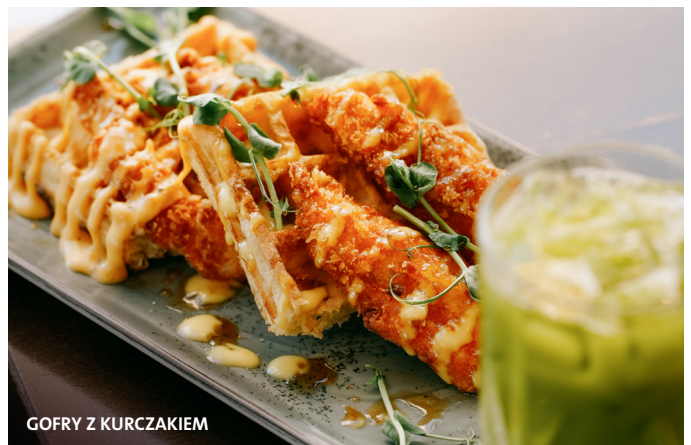
GOFRY Z KURCZAKIEM