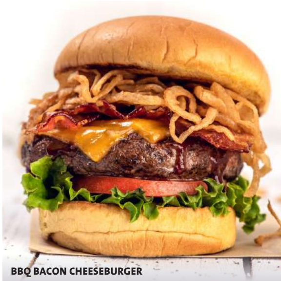
BBQ BACON CHEESEBURGER

Dos Smash Burgers apiladas, sazonadas y grilladas, con queso pepper jack (picante), cebolla chipotle, lechuga, tomate en rodaja y mayonesa picante.* $25500