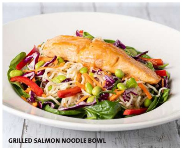
GRILLED SALMON NOODLE BOWL