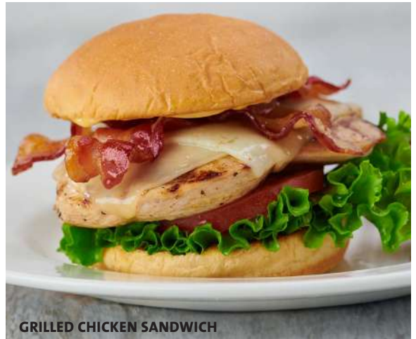
GRILLED CHICKEN SANDWICH