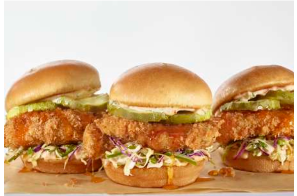
FRIED CHICKEN SLIDERS

Añade guacamole $7300. Añade pollo a la parrilla $7000 o carne de res a la parrilla* $9500