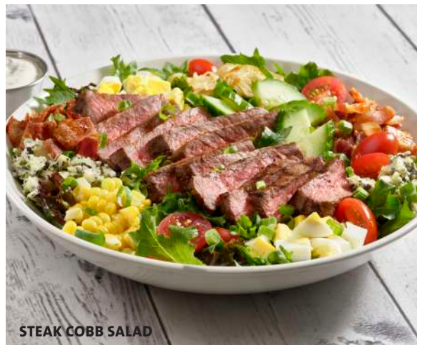
STEAK COBB SALAD