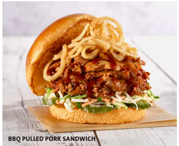
BBQ PULLED PORK SANDWICH

Pollo grillado con salsa de mostaza y miel, queso Monterey Jack derretido, panceta ahumada, hoja de lechuga y tomate en rodaja, servido en un pan recién tostado. $23000