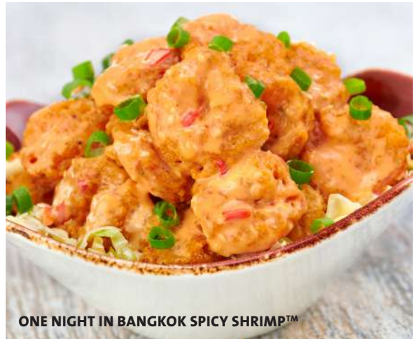
ONE NIGHT IN BANGKOK SPICY SHRIMP™

Camarones crujientes, bañados en una salsa cremosa y picante. Cubierto con cebolla de verdeo, servidos sobre ensalada de Col Bangkok (picante) con tiras de tortilla de harina . $26500