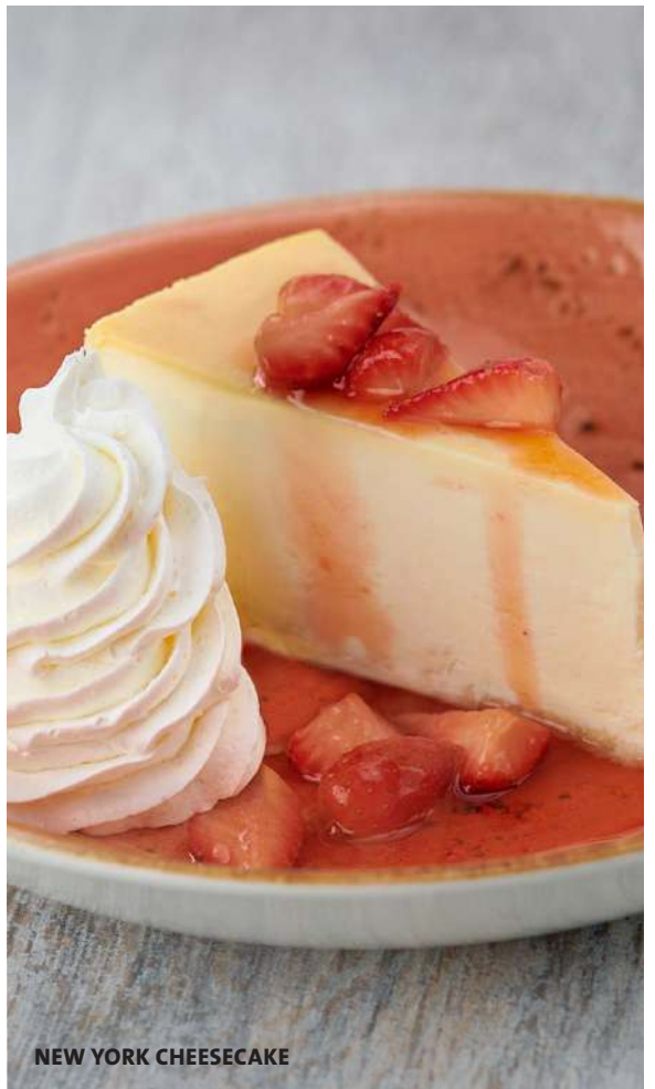
NEW YORK CHEESECAKE