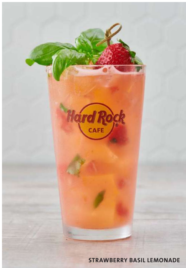
STRAWBERRY BASIL LEMONADE

Coca-Cola , Coca-Cola Zero Sugar , Sprite Zero Sugar .