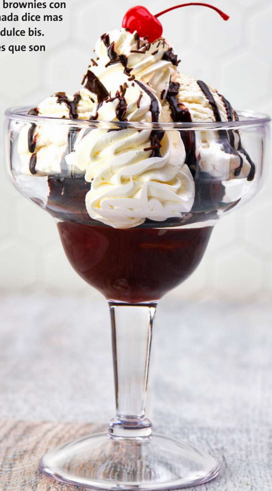
HOT FUDGE BROWNIE

Desde batidos hasta brownies con chocolate caliente, nada dice mas rock n' roll como un dulce bis. ¡Salud por los postres que son geniales!