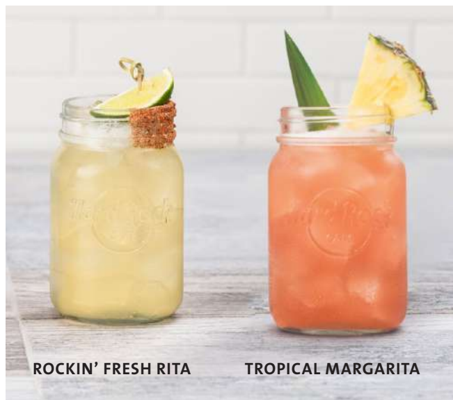
ROCKIN' FRESH RITA

Vodka Smirnoff, Ron Silver Premium, Gin Premium y Blue Curaçao con sweet & sour y terminado con Red Bull® Yellow Edition. $12500