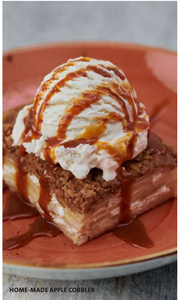
HOME-MADE APPLE COBBLER

Disponemos de cajas de comida para llevar gratuitas para que aproveches al máximo tu experiencia gastronómica