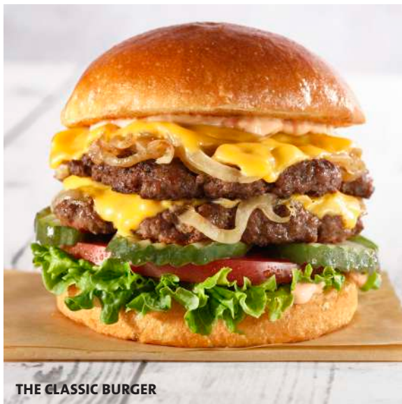
THE CLASSIC BURGER