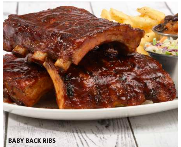
BABY BACK RIBS

Costillas sazonadas con nuestra mezcla de especias, glaseadas con nuestra salsa barbacoa casera asadas a la perfección. Servido con papas fritas, ensalada de col y porotos ahumados. $39000