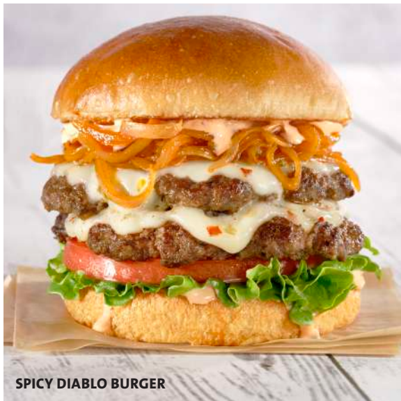
SPICY DIABLO BURGER