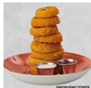
ONION RING TOWER