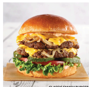
CLASSIC SMASH BURGER