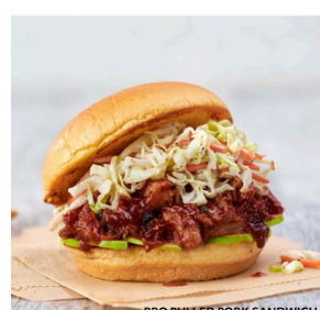
BBQ PULLED PORK SANDWICH