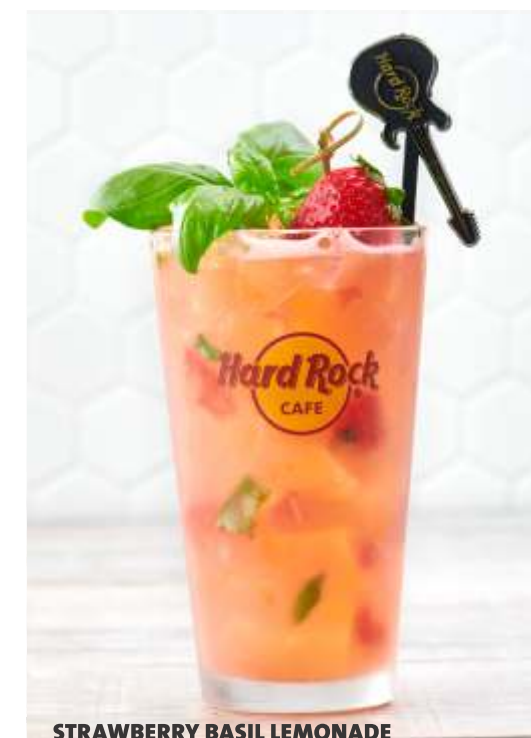
STRAWBERRY BASIL LEMONADE

Una mezcla tropical de mangos, frutilla, jugo de piña y jugo de naranja, mezcla agridulce y un toque de soda lima - limón.