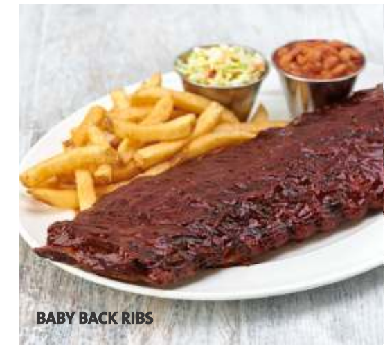
BABY BACK RIBS

Sazonada con nuestra exclusiva mezcla de especias, luego glaseada con nuestra salsa barbecue hecha en casa y asada a la perfección, servida con papas fritas sazonadas, ensalada coleslaw y frijoles estilo rancho.