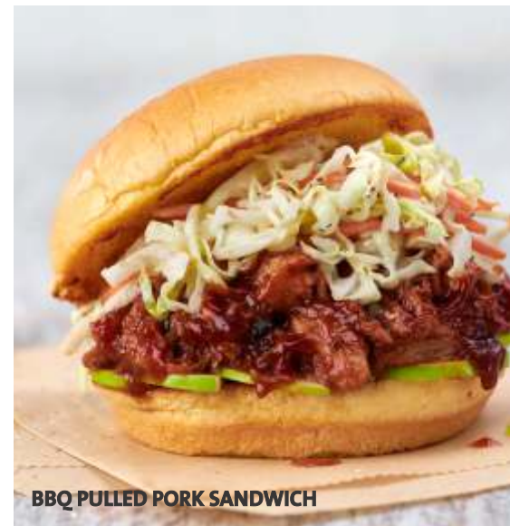
BBQ PULLED PORK SANDWICH

Papas fritas Sazonadas Cheese Fries con Bacon Vegetales frescos del día Twisted Mac & Cheese Aros de Cebolla Puré de Papas