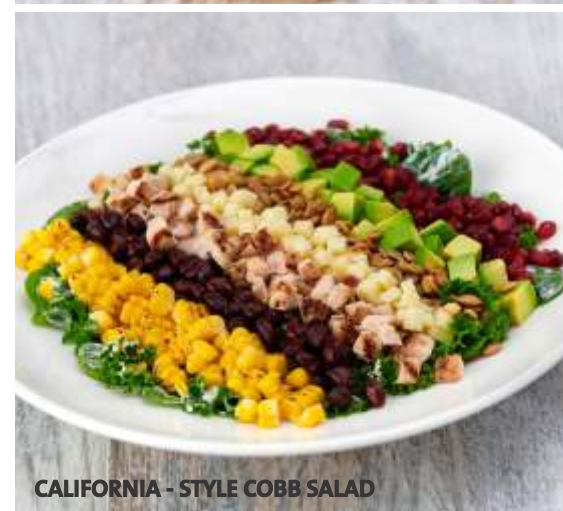
CALIFORNIA - STYLE COBB SALAD