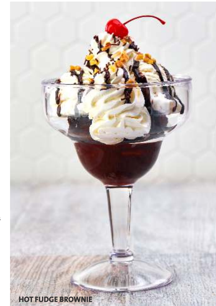
HOT FUDGE BROWNIE

Elige entre nuestros sabores de vainilla, chocolate dulce de leche o frutilla.