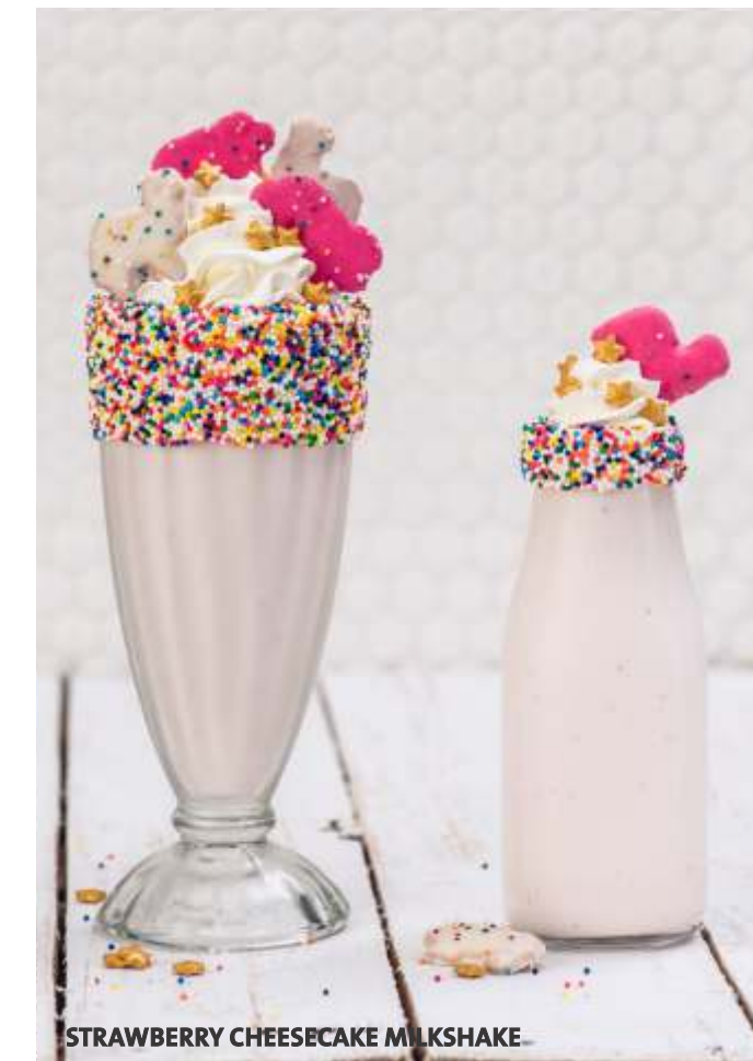
STRAWBERRY CHEESECAKE MILKSHAKE

Versión sin alcohol, servida en una exclusiva mini - milk jug.