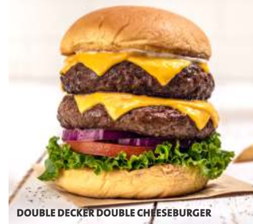
DOUBLE DECKER DOUBLE CHEESEBURGER