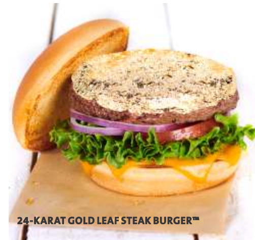
24-KARAT GOLD LEAF STEAK BURGER™