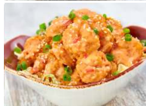
ONE NIGHT IN BANGKOK SPICY SHRIMP™