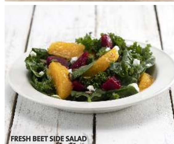
FRESH BEET SIDE SALAD