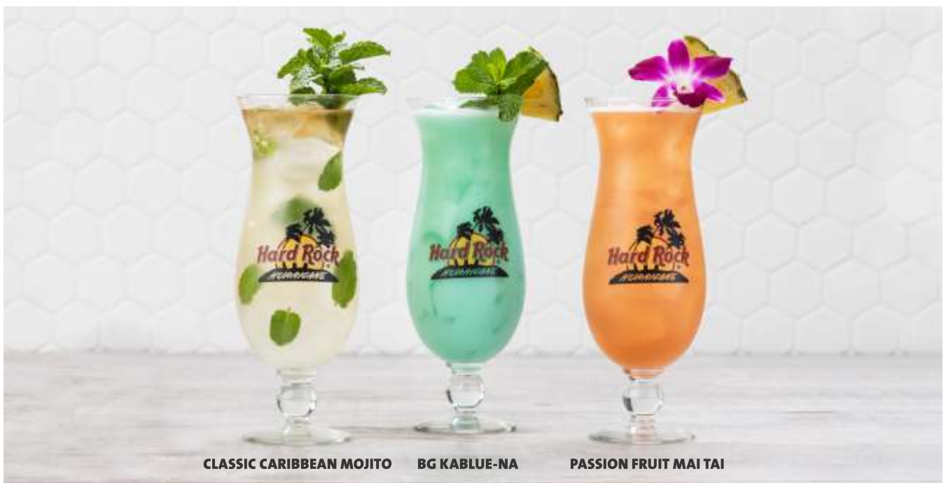
CLASSIC CARIBBEAN MOJITO