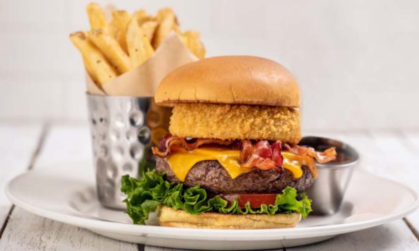
ORIGINAL LEGENDARY BURGER®

Al igual que las cuerdas de una guitarra deben estar perfectamente afinadas para tocar una gran melodía, cada detalle importa para las hamburguesas Legendary® de Hard Rock.