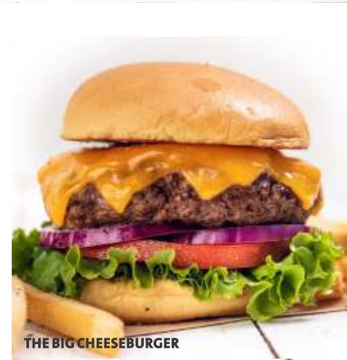
THE BIG CHEESEBURGER

NEW Boozy Milkshakes (elige entre Strawberry Cheesecake o Cookies & Cream)