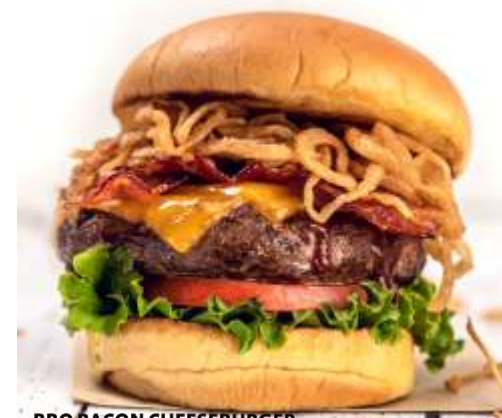
BBQ BACON CHEESEBURGER