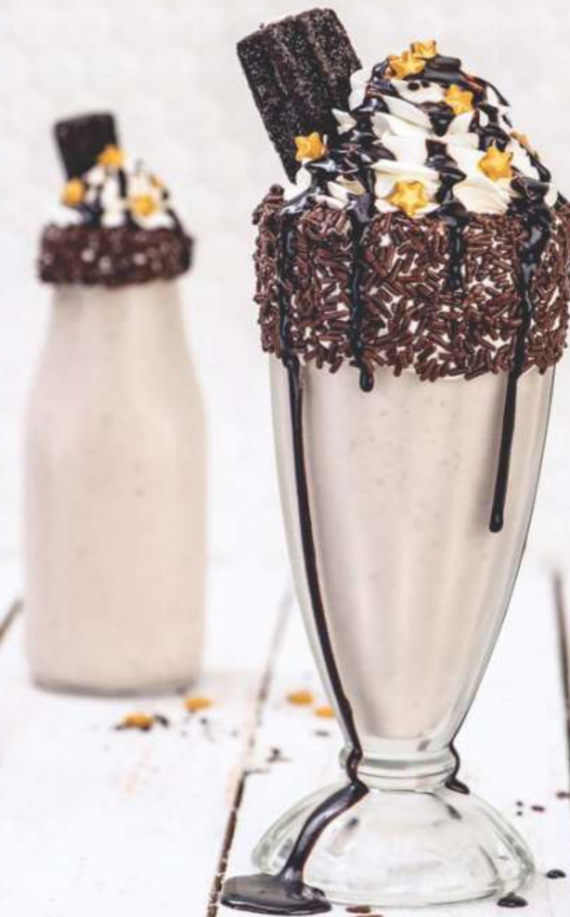
COOKIES & CREAM MILKSHAKE

De los Boozy Milkshakes hasta el Hot Fudge Brownie, nada habla mejor del rock n' roll que mimarte con algo dulce ¡Salud por los buenos postres!